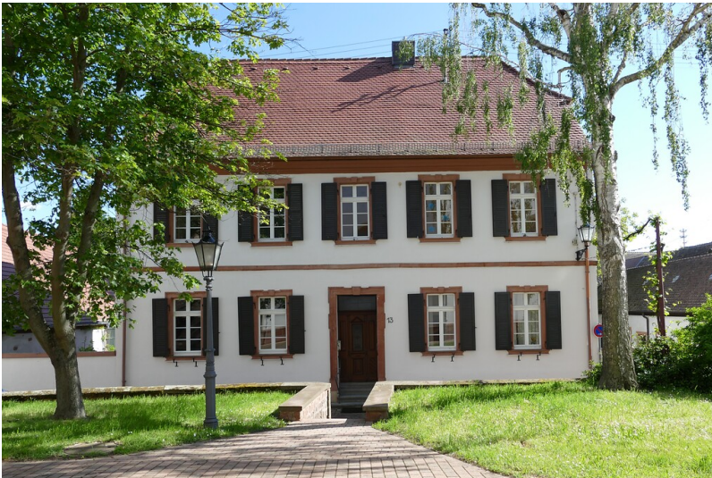
Das barocke Pfarrhaus in Kirrweiler (2021)