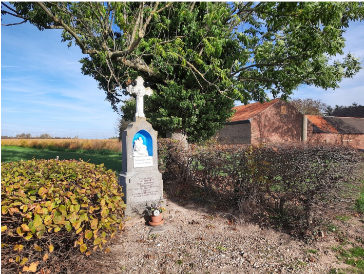
Hofkreuz am Sittarder Hof (2022)