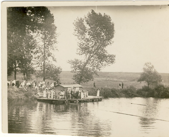
Fronweiher (1920-1950)