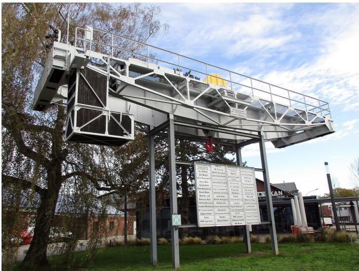
Ein Blickfang im Gewerbe- und Industriegebiet "Leskan Park" in Köln-Dellbrück ist der zentral aufgestellte Kran "No. 481" mit 30 Tonnen Tragkraft, im Jahr 1905 gebaut von der Benrather Maschinenfabrik AG (2022).