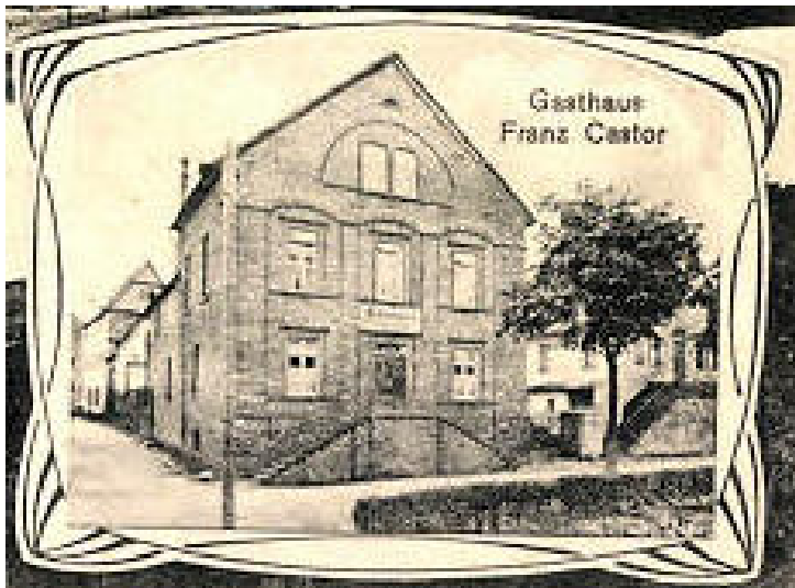
Das Hotel Reis in Treis, damals Gasthaus Franz Castor (1910)