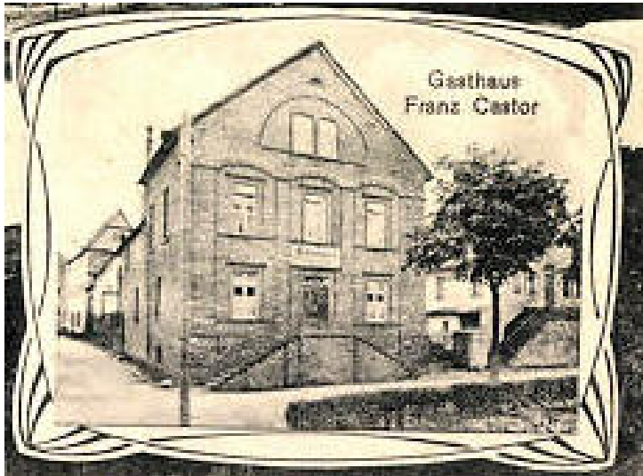
Das Hotel Reis in Treis, damals Gasthaus Franz Castor (1910)