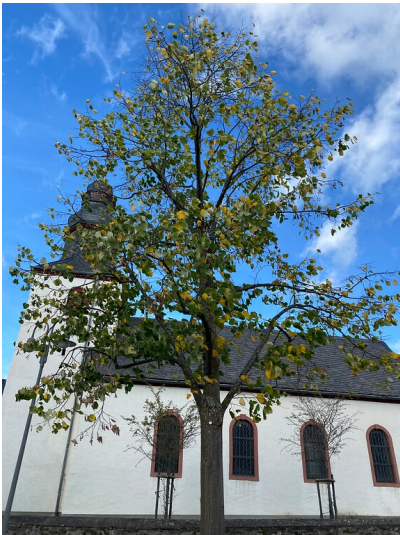
Lindenbäumchen vor der Kirche in Altstrimmig, im Hintergrund die Kirche von Altstrimmig (2022).