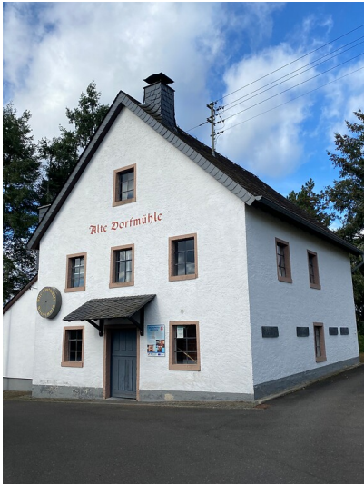
Aufnahme der Alten Dorfmühle in Altstrimmig aus Sicht der Kirchstraße (2022).