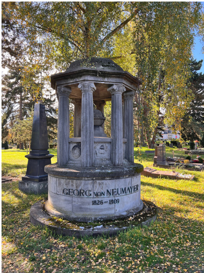
Grabmal Georg von Neumayer in Neustadt an der Weinstraße