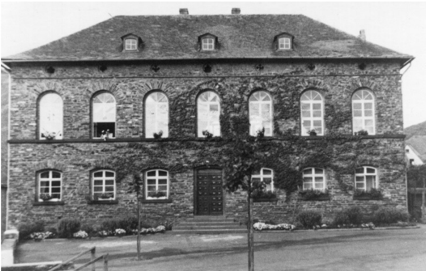
Die ehemalige Knabenschule im Ortsteil Treis (um 1950)