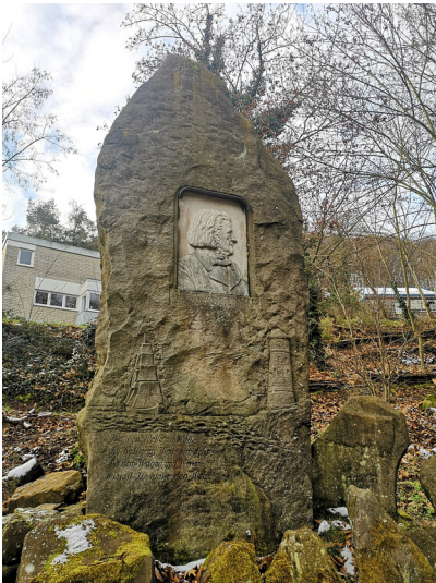
Gedenkstein Georg von Neumayer in Neustadt an der Weinstraße