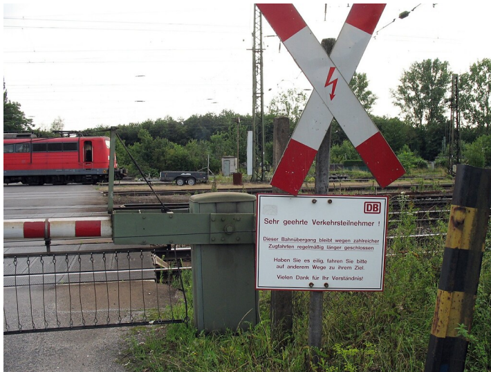
Der Bahnübergang am Ende des Rangierbahnhofs Gremberg an der Porzer Ringstraße in Köln-Gremberghoven (2010).