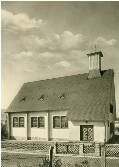
Historische Abbildung der alten evangelischen Kirche in der Rathenaustraße in Plaidt (1950er Jahre)