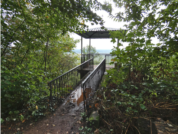
Schöner Punkt oberhalb Villa Ludwigshöhe