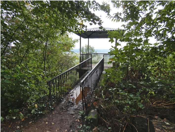
Schöner Punkt oberhalb Villa Ludwigshöhe