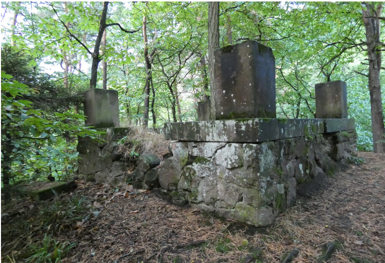
Luitpoldpavillon bei Edenkoben