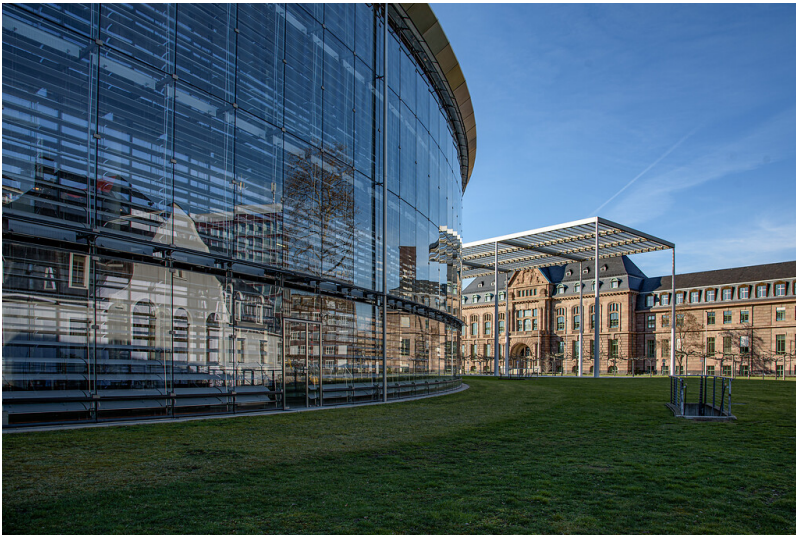
Konzernzentrale und alte Hauptverwaltung Bayer AG (2021)