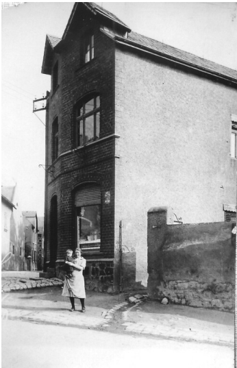
Das Haus "Kanters Eck" in der Hauptstraße 1 in Plaidt (1930er Jahre)