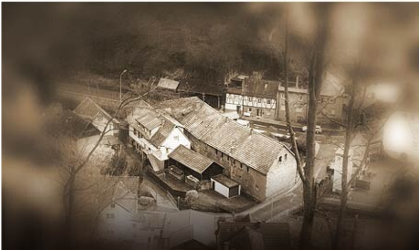
Historische Wappenschmiede Elmstein