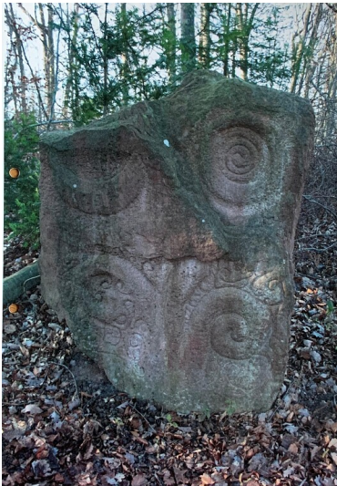
Stein des Sehens