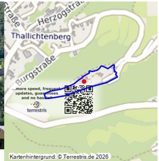
Die Burg Lichtenberg bei Thallichtenberg - eine virtuelle 360-Grad-Tour (2023)

Die Burg Lichtenberg ist mit einer Länge von 425 Metern eine der längsten und größten Burganlagen Deutschlands und die größte Burg unter den Burgen und Burgruinen der Pfalz . Im späten 12. oder frühen 13. Jahrhundert wurde sie illegal auf dem Gebiet des Klosters Saint Remi aus Reims durch Graf Gerlach III. von Veldenz errichtet. Sie diente verschiedenen Besitzern als Verwaltungssitz. Nach Verlegung des Oberamtes Lichtenberg 1758 verlor sie allerdings mehr und mehr an Bedeutung. Ein Großbrand im Jahre 1799 und die Nutzung als Steinbruch beschleunigte den Niedergang. 1898 wurde sie unter Denkmalschutz gestellt und kam letztendlich 1971 in den Besitz des Landkreises Kusel. Seitdem findet die Burg als „Schatzkästlein“ vor allem im touristischen und kulturellen Bereich große Bedeutung. Die letzte große (Aus-)Baumaßnahme erfolgte in den Jahren von 2020 - 2022 im Rahmen des Förderprojektes „Tourismus für Alle“. Heute ist der 33 Meter hohe Bergfried das markanteste Merkmal der Burg Lichtenberg. Zu diesem Objekt gibt es einen interaktiven 360-Grad-Rundgang und eine Übersichtsseite zu allen Multimedia-Bestandteilen .