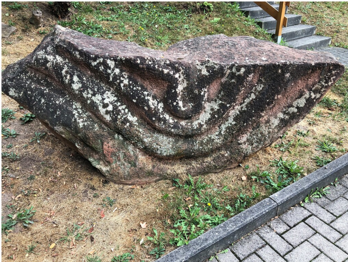
Stein des Hörens in Neidenfels (2022)