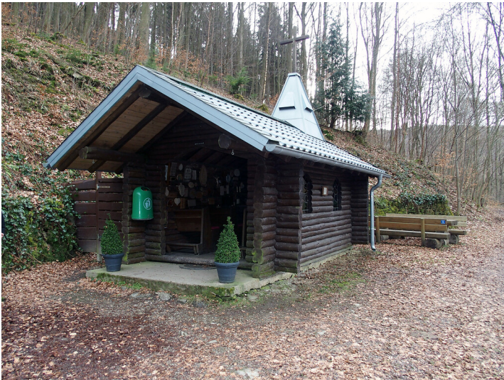
Waldkapelle Erkensruhr (2017)