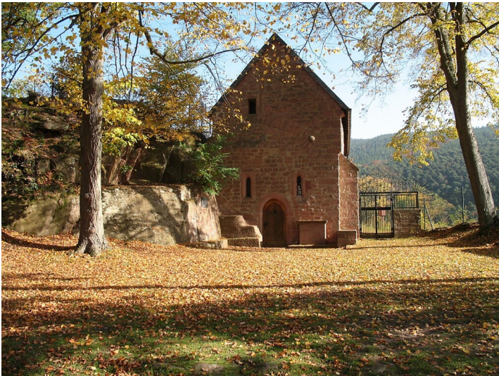
Cyriakus Kapelle in Lindenberg