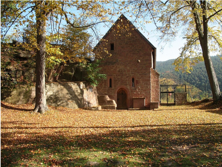
Cyriakus Kapelle in Lindenberg