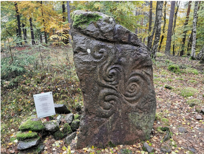
Wind- und Wolkenstein in Frankeneck