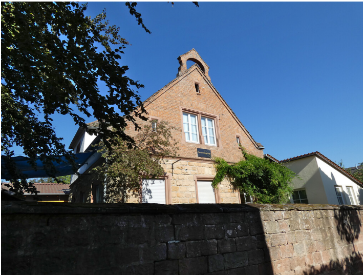
Kommunale Kindertagesstätte Theresienkleinkinderschule in Rhodt unter Rietburg