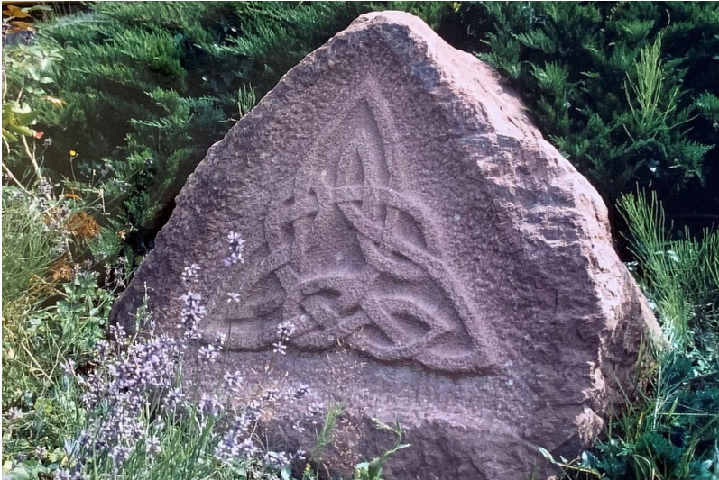
Schenkungsstein in Frankeneck