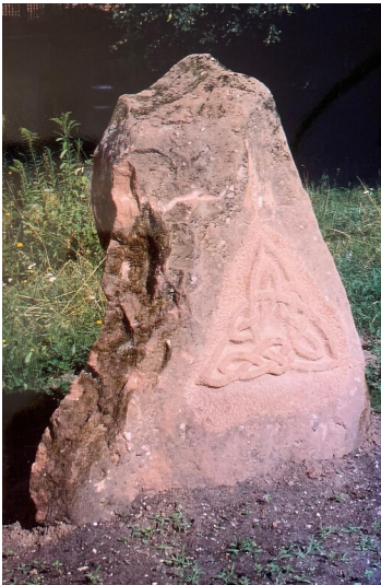
Erdenstein in Frankeneck