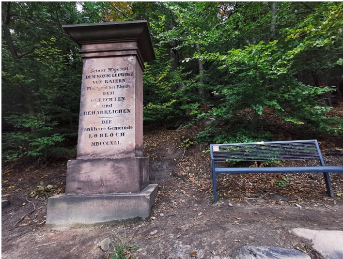
Loblochstein in Lindenberg (Pfalz)