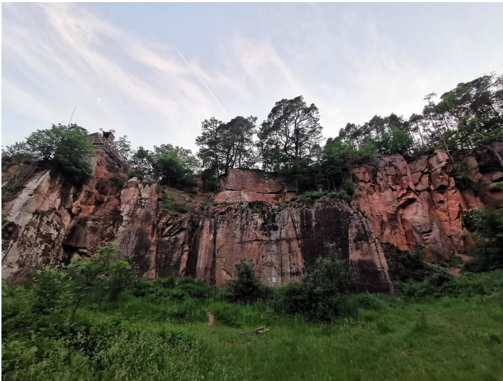
Steinbruch am Gerbersberg - Lindenberg (Pfalz)