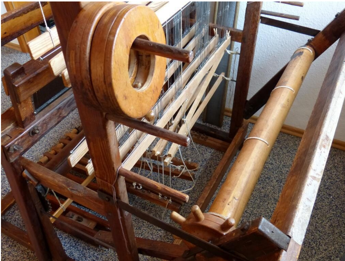
Webermuseum "Vom Zwirn zum Stoff" in Lindenberg