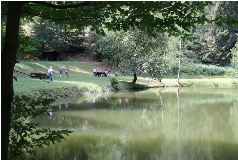
Morschbacher Weiher