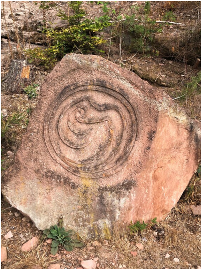
Langecker Stein - Sonnenstein in Weidenthal (2022)