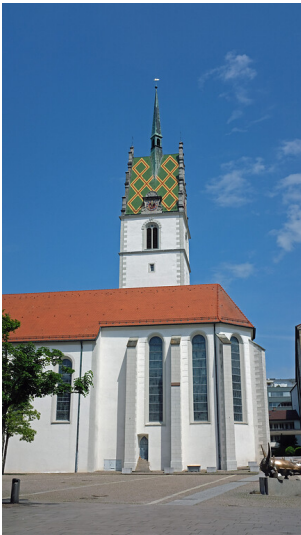
Katholische Stadtkirche Sankt Nikolaus in Friedrichshafen (2022)