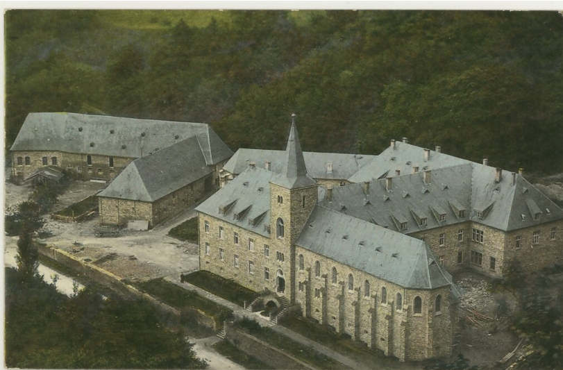
Historische Fotografie des Klosters Maria Engelport bei Treis-Karden (1907)

Schlagwörter: Klosterkirche Fachsicht(en): Landeskunde Gemeinde(n): Treis-Karden Kreis(e): Cochem-Zell Bundesland: Rheinland-Pfalz