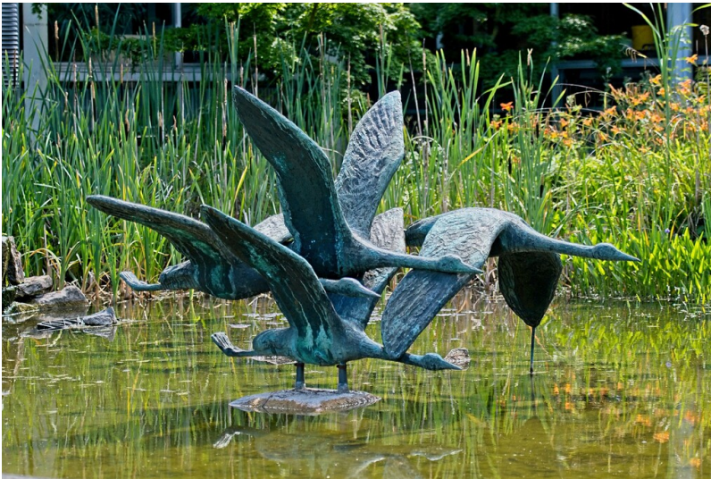
Bronzeskulptur "Fliegende Kraniche" im Brunnen am Klubhaus der Riehler Heimstätten in Köln-Riehl (2020).