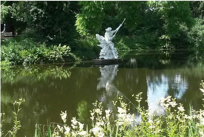
Die Bronzeskulptur "Neptun" im Weiher des Botanischen Gartens Flora in Köln-Riehl (2014). Fotograf/Urheber: Gerd Bermbach