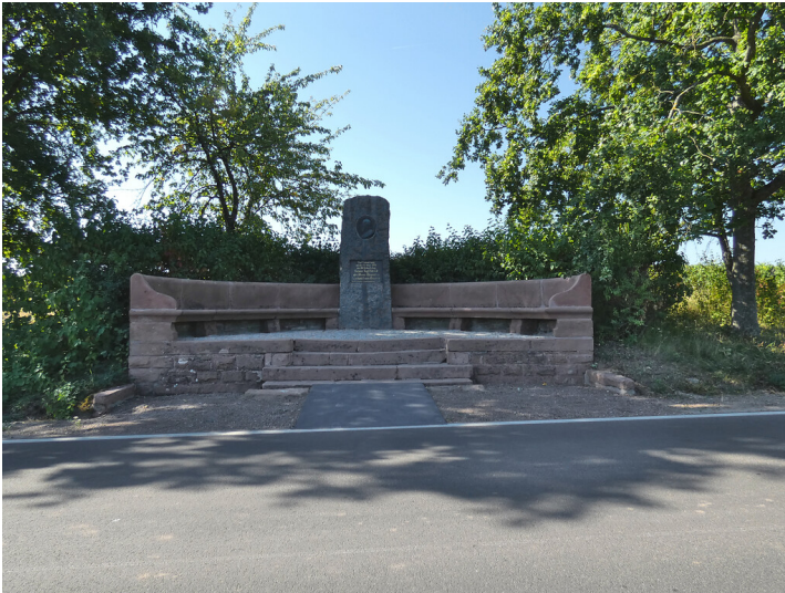
Luitpold-Denkmal an der Villastraße bei Edenkoben