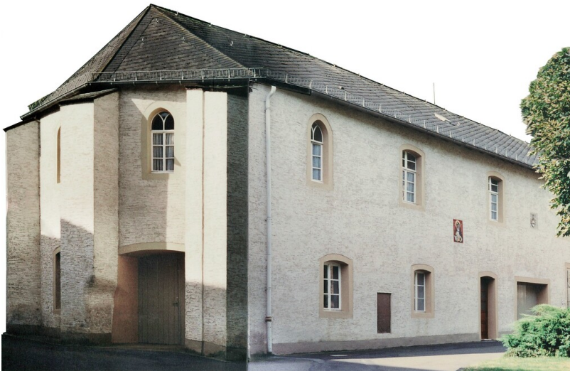
Die alte Klosterkirche im Kloster Maria Engelport bei Treis-Karden (2001)

Schlagwörter: Klosterkirche Fachsicht(en): Landeskunde Gemeinde(n): Treis-Karden Kreis(e): Cochem-Zell Bundesland: Rheinland-Pfalz