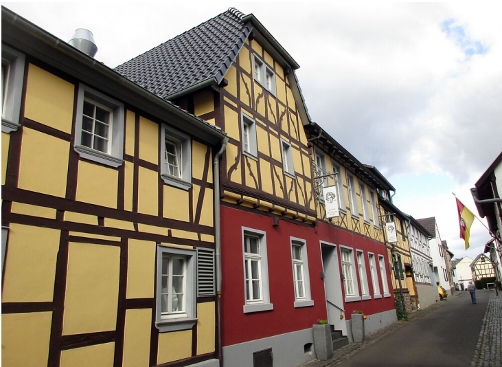
Kleine Beethovenhalle in Bonn-Muffendorf (2022): Die Hausfront in der Muffendorfer Hauptstraße mit dem älteren Eingang zur Gastwirtschaft und der Halle.