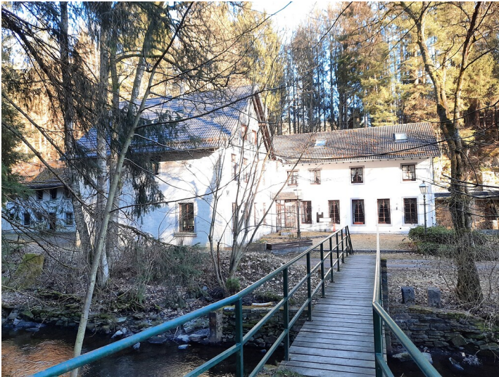
Hotel Perlenau (2022)