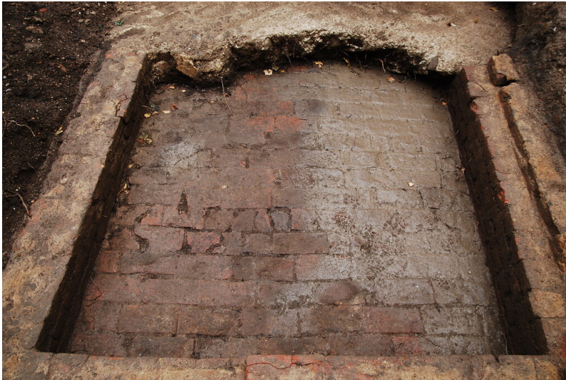
Zülpich, Kölnstraße (2021). Ausgrabung im Hinterhof. Blick auf den freigelegten Ziegelsteinboden eines in den 1930er-Jahren aufgegebenen und verfüllten Raums Stelle 9