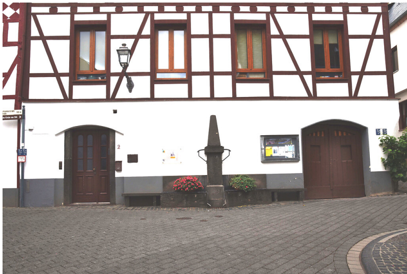
Ehemaliger Dorftreffpunkt Boa in St. Aldegund