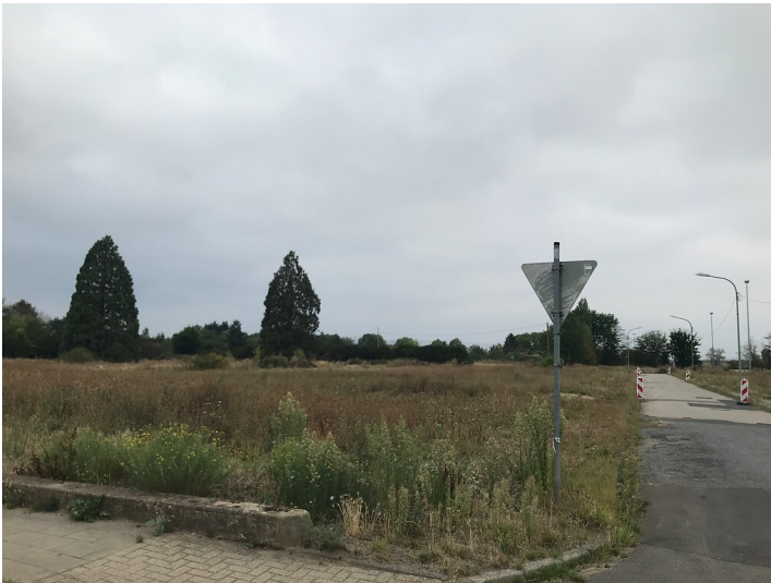
Ehemaliger Siedlungsbereich in Morschenich-Alt. Die Wohnhäuser wurden im Vorfeld der anstehenden Umsiedlung bereits abgerissen (2022)