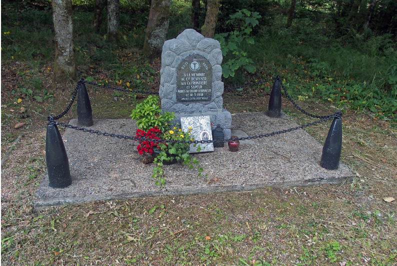
Denkmal für den Soldaten Devisser (2022)