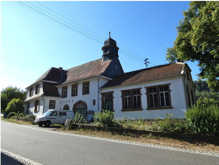
Altes Schulhaus in Steinalben