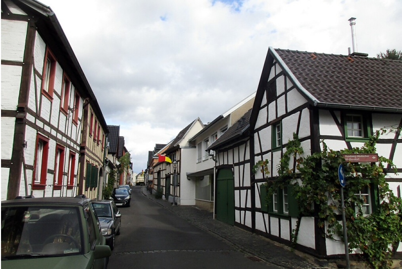
Blick über die von Fachwerkhäusern geprägte Muffendorfer Hauptstraße in Bonn-Muffendorf (2022).