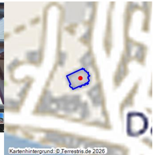
Kirche Sankt Kastor in Dausenau - ein virtueller Rundgang (2021)

Die heute evangelische St. Kastorkirche erhebt sich wie eine Glucke auf einem Felsen über dem alten von einer Ringmauer umschlossenen Ortskern von Dausenau. Die Kirche wurde ursprünglich der Jungfrau Maria, der heiligen Maria Magdalena und dem heiligen Kastor geweiht und beherbergt mit dem romanischen Kirchturm aus dem 12. Jh. das älteste Bauwerk Dausenaus. Zu diesem Objekt gibt es einen interaktiven 360-Grad-Rundgang .