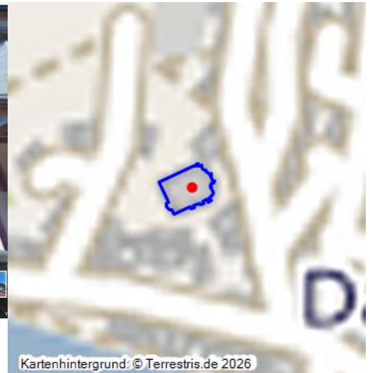
Kirche Sankt Kastor in Dausenau - ein virtueller Rundgang (2021)

Die heute evangelische St. Kastorkirche erhebt sich wie eine Glucke auf einem Felsen über dem alten von einer Ringmauer umschlossenen Ortskern von Dausenau. Die Kirche wurde ursprünglich der Jungfrau Maria, der heiligen Maria Magdalena und dem heiligen Kastor geweiht und beherbergt mit dem romanischen Kirchturm aus dem 12. Jh. das älteste Bauwerk Dausenaus. Zu diesem Objekt gibt es einen interaktiven 360-Grad-Rundgang .