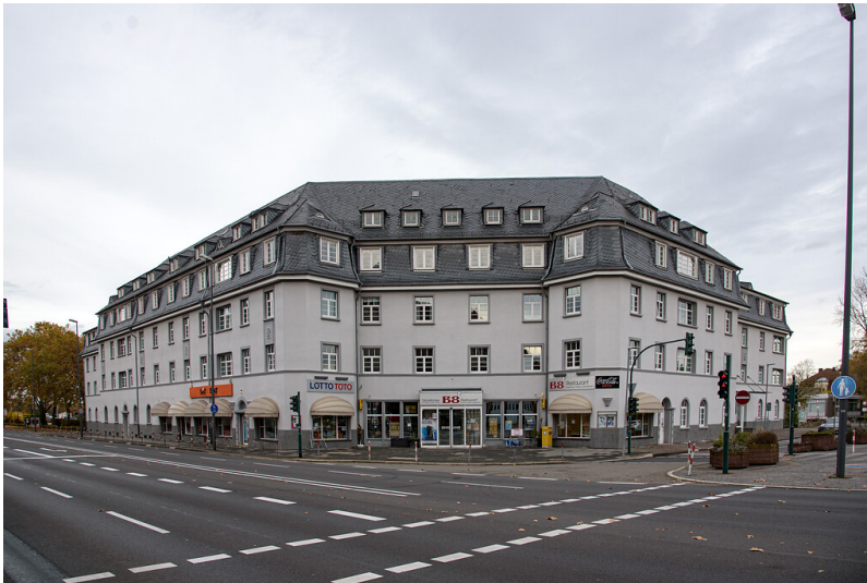
Bayer-Kaufhaus in Leverkusen (2021)