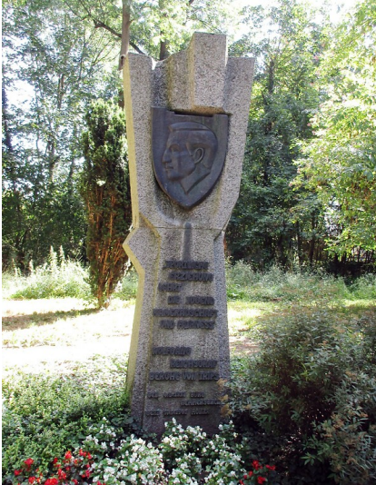
Das Denkmal für Wolfgang Reichsgraf Berghe von Trips nahe der "Alten Burg" im Stadtpark Horrem (2022).